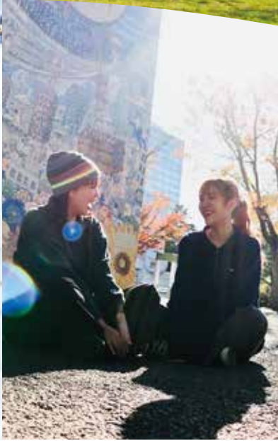
かんきょうコンサート TSM Shibuya presents ～ How Can We? ～