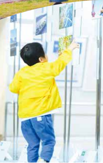
かんきょう「組写」 フォトコンテスト 「地球のこと、自分のこと。」