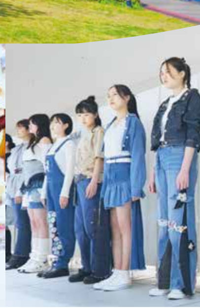
リメイクファッション 作品展示 & ファッションショー 作品テーマ「新しく繕ふ」