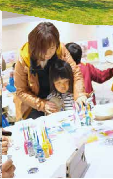
アップサイクル広場 (ワークショップ)